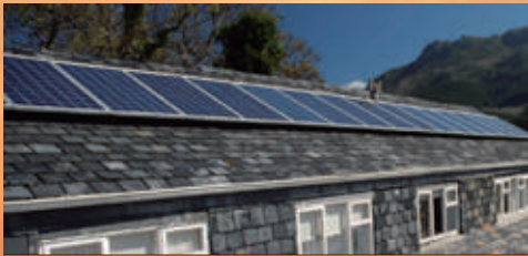
4.5KW | São Paulo, Brazilië