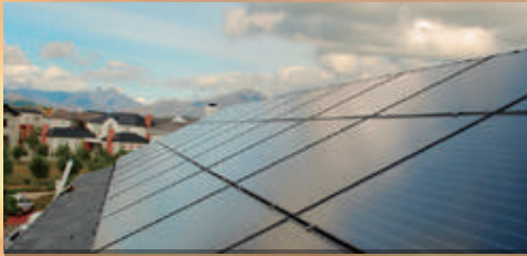
6KW | Istanbul, Turkije