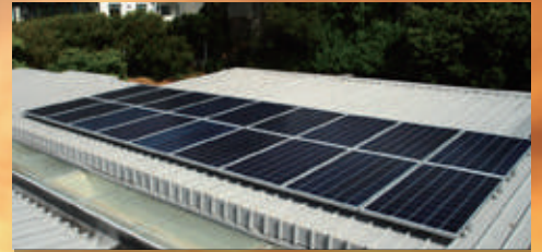
4.5KW | Berwickshire, VK