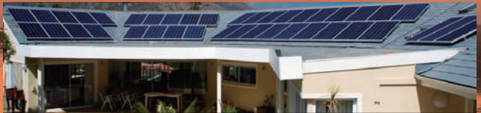
10KW | Kaapstad, Zuid-Afrika