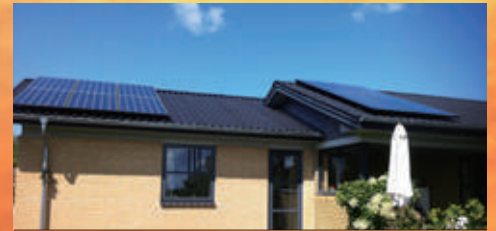
3KW | Amsterdam, Nederland