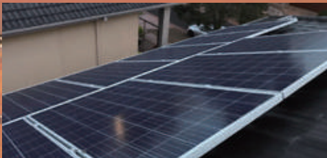
3.6KW | Melbourne, Australië