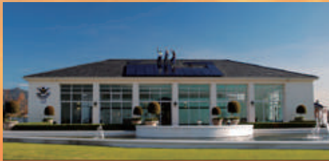
12KW | Kaapstad, Zuid-Afrika